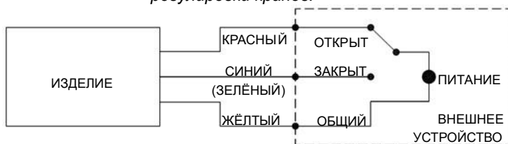
Рисунок 2. Схема подключения изделия.